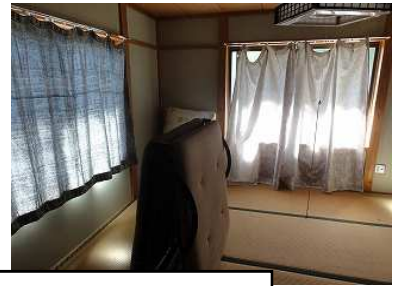
付属家 2階建あり (1F車庫、2F和室)