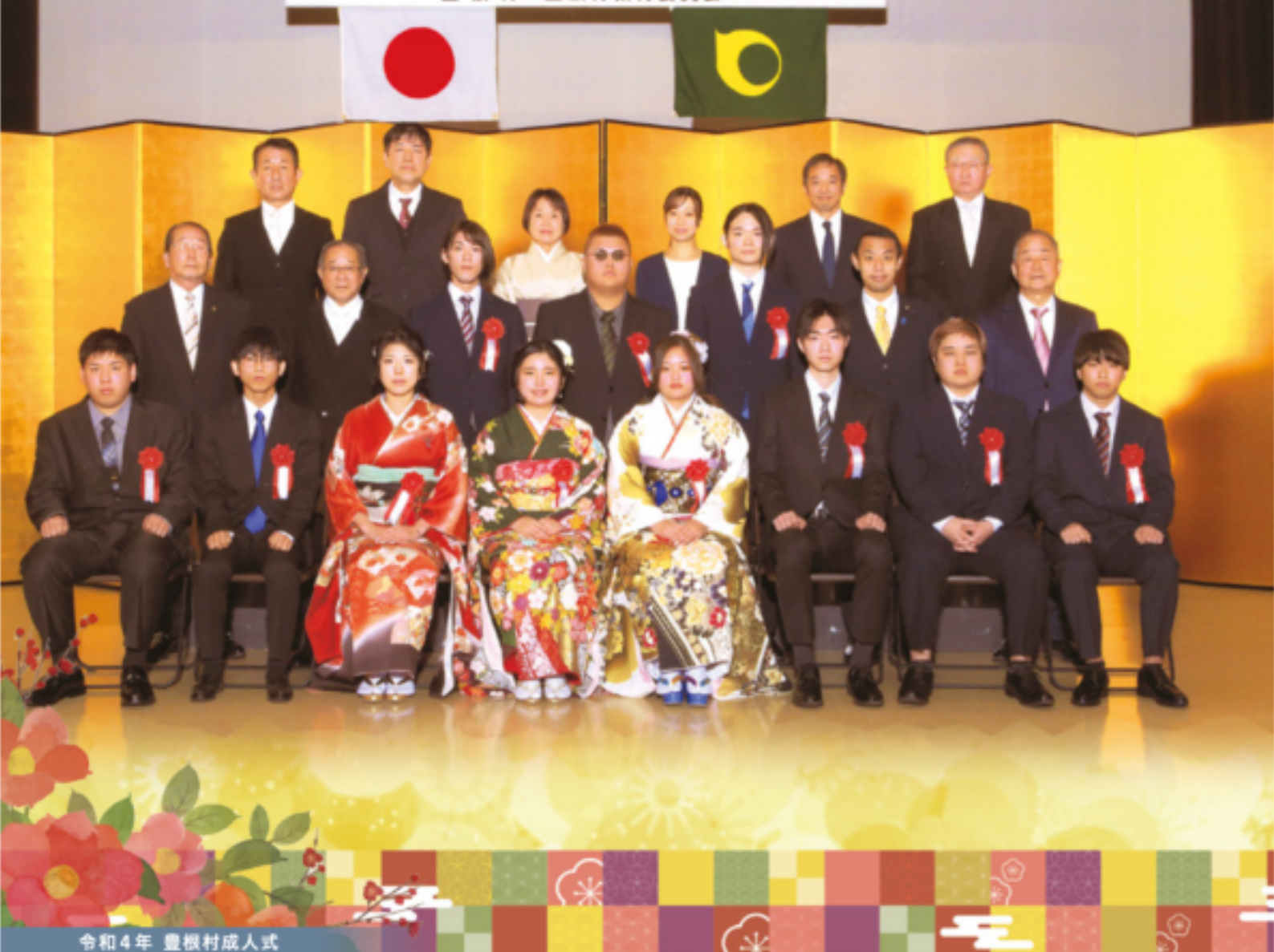
令和4年 豊根村成人式