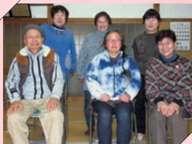
牧舟体操クラブの紹介