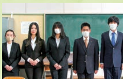
スーツを着た生徒たち

12月21日(木)、3年生を対象とした教養講座の一場で「スーツの着こなし講座」を行いました。鈴